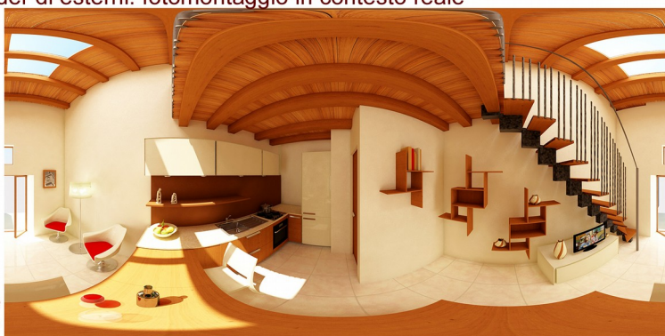
Panoramica per visualizzazione navigabile a 360°