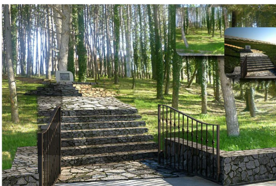
Render di esterni: fotomontaggio in contesto reale